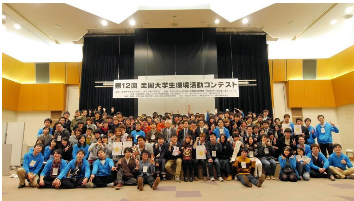
ecocon2014 最終選考での集合写真