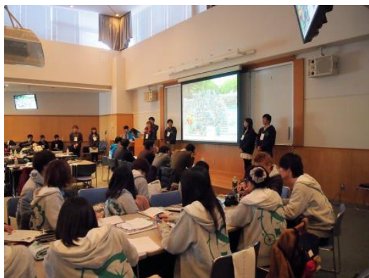
グループ選考の様子